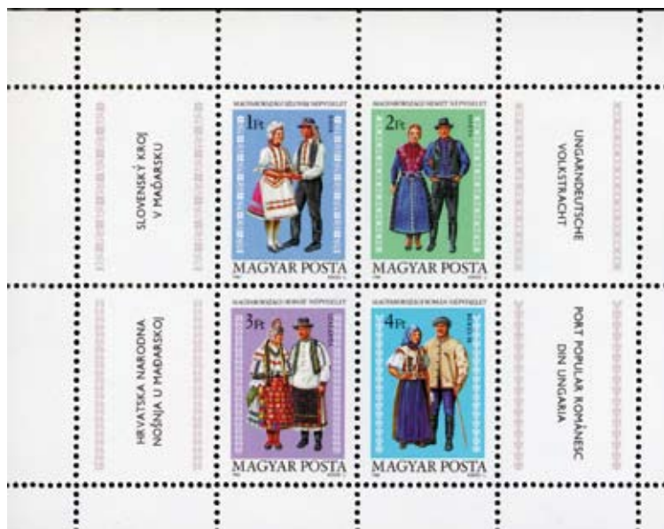
5. kép: A Magyar Posta 1981-es, hazai nemzetiségi népviseleteket bemutató bélyegblokkja. A magyarországi németseget egy hართai pár képviseli (Azonosítószáma: MPIK 3478 a-dB. Saját tulajdon)