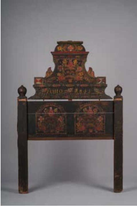
1. kép: Ismeretlen mester által készített hartai ággyvég 1855-ből (Néprajzi Múzeum, Bútor- és világítóeszköz-gyűjtemény, NM 60.75.27, gy.: Csilléry Klára, 1960. Fotó: Szász Marcell)