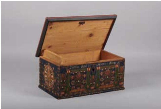
3. kép: Ismeretlen mester által készített hartai kisláda 1871-ből (Néprajzi Múzeum, Bútor- és világítóeszköz-gyűjtemény, NM 130573 gy.: Kungazda János, 1931.)