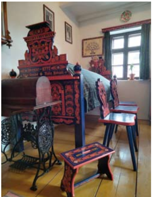
10–13. kép: Részletek a hartai tájhaból