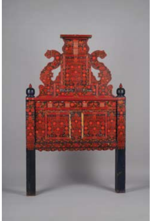
2. kép: Knodel János által készített hartai ággyvég 1938-ból (Néprajzi Múzeum, Bútor- és világítóeszköz-gyűjtemény, NM 64.68.1, gy.: Csilléry Klára, 1964. Fotó: Szász Marcell)