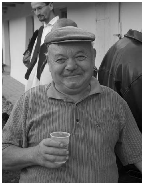
3. kép A vizsgált generációhoz tartozó férfi.