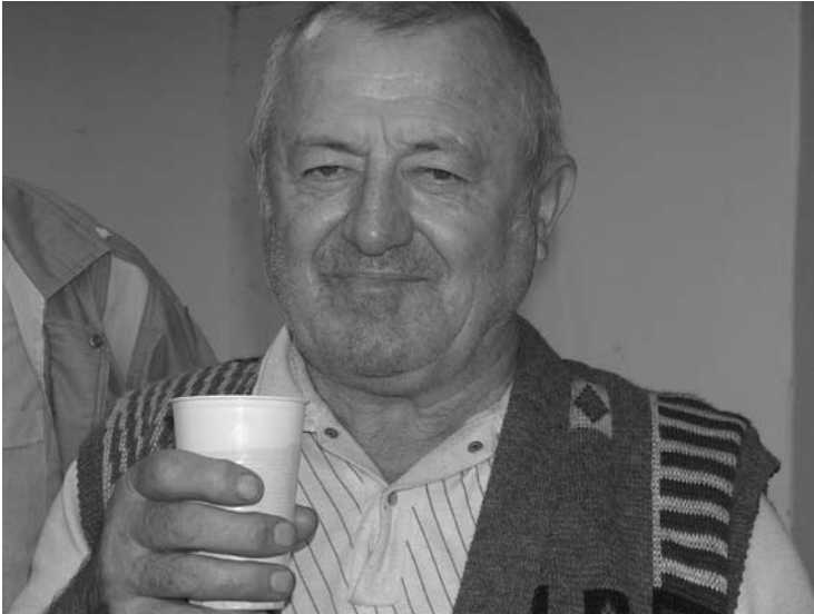
2. kép A vizsgált generációhoz tartozó férfi.