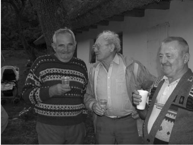
1. kép A vizsgált generációhoz tartozó férfiak.