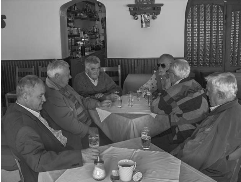
5. kép A vizsgált generációhoz tartozó férfiak.