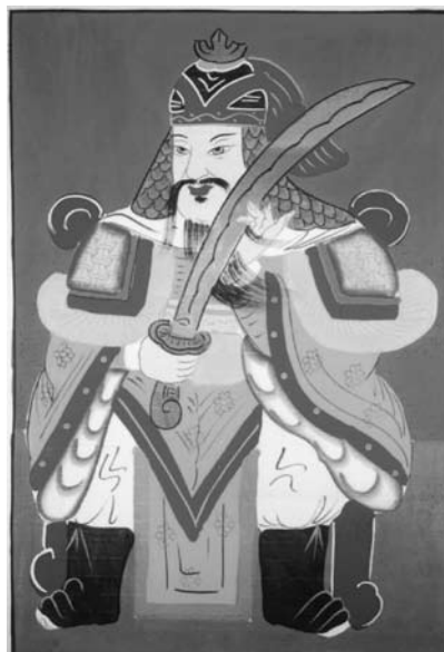
9.b kép A hadvezér isten