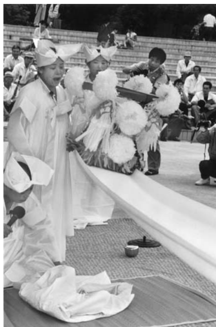
14. kép Halottbúcsúztató sámánszertartás előadása