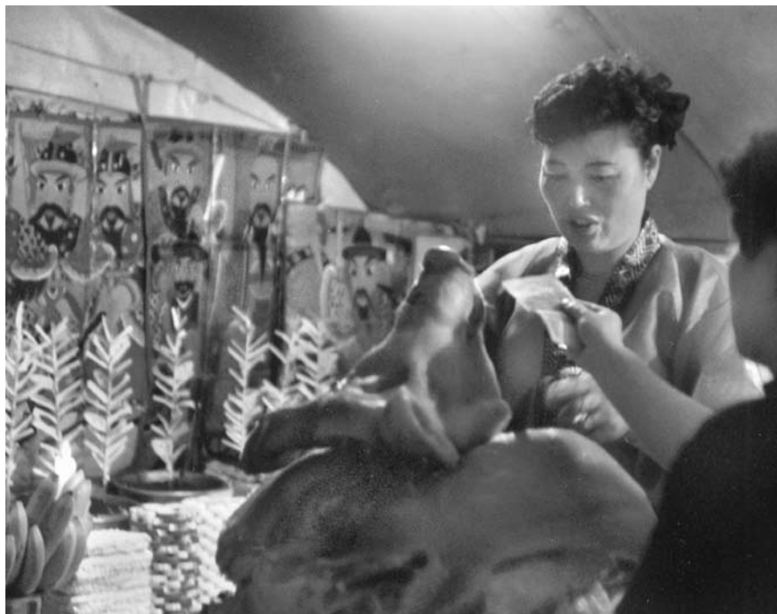
12.a kép Az állatáldozat kiegyensúlyozása (1994)

részt, ugyancsak Daniel Kister kolléga társaságában, aki folyamatosan kommentálta a ceremónia eseményeit. Így aránylag jó jegyzetekkel rendelkezünk erről a két sámánszertartásról. Ennek a második napi szertartásnak – mint kiderült – a főszereplője a fiatalabb sámánasszony lett, mert ő volt az, aki a megrendelő fiatal házaspár számára a szerencsevarázslást ( saenam kut ) elvégezte. Ő volt az, aki a szellemhívó táncot eljárta, majd a disznóáldozatot bemutatta, s végül sötétedés előtt mezítláb a pengeéles szecs kavágó kardokra felállt.