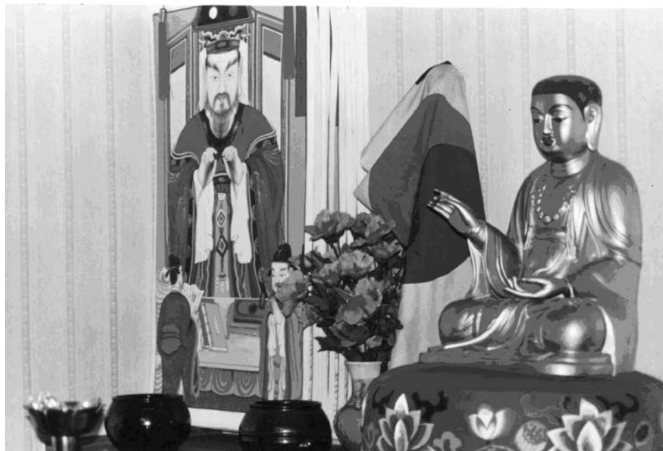
1. kép A budhizmus és a samanizmus keveredése egy sámánasszony szentélyében (1991 – minden fotó a szerző felvétele)