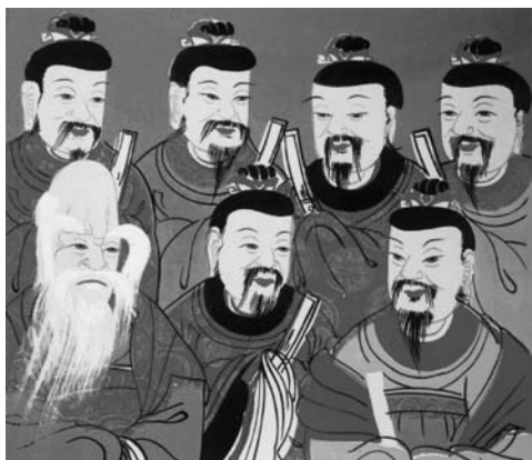
8.a kép A Göncöl csillagait jelképező 'ikon'

zetői, mondhatnánk, papnői funkciójuk nem jár semmiféle megszorítással a normális családi életet illetően. A koreai sámánság egyik jellegzetessége éppen az, hogy a több órás rítust egyfajta oldottság jellemzi, ahol a profán