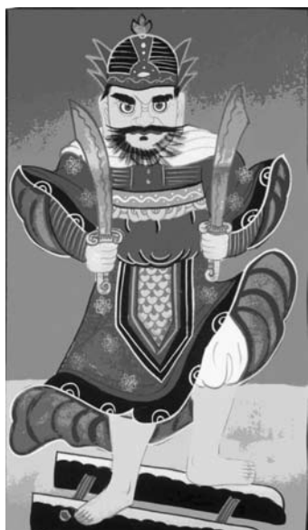
9.a kép A szecskavágókésekre álló isten