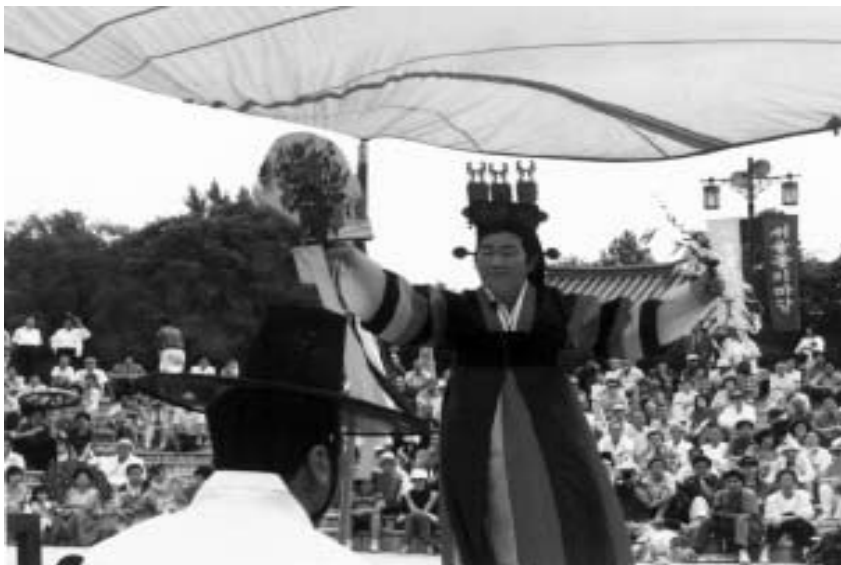
13. kép Szabadtéri sámánelőadás Szöulban (1994)