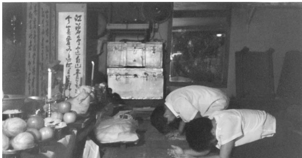
6. kép A szertartást megrendelő házaspár leborult a sámán-oltár előtt