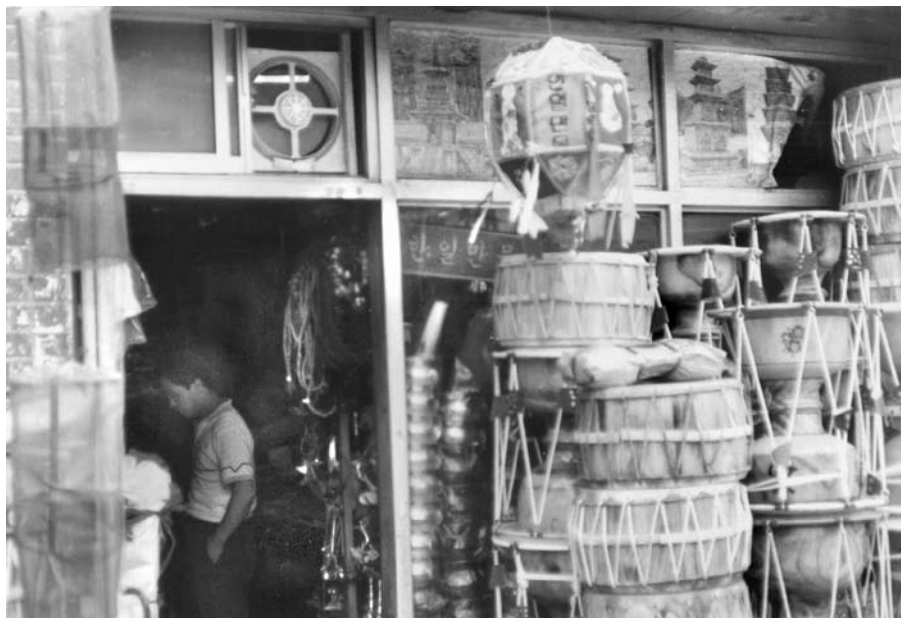
7. kép A sámánfelszerelések boltja, kétféle dob a bejárat mellett

Ezekben az üzletekben meg lehet venni azokat a „sámánikonokat” is, amelyek elengedhetetlenül szükségesek a sámánasszonyok szentélyeinek, illetve a sámánszertartások oltárainak a feldíszítéséhez. 10 Ezeket az ikonokat a régi minták alapján újra és újra festik, és természetesen a maiak már kevésbé kidolgozottak, mint a korábbiak, de híven követik a hagyományokat abban a tekintetben, hogy a sámánszertartásokra meghívandó szellemsegítők mindegyikének szerepelnie kell, akár egyedül, akár csoportosan, mint például a Göncöl hét csillagát jelképező hét férfialak ( Musindo ), vagy a három fehér fejedőt viselő Buddhát ábrázoló képek. 11