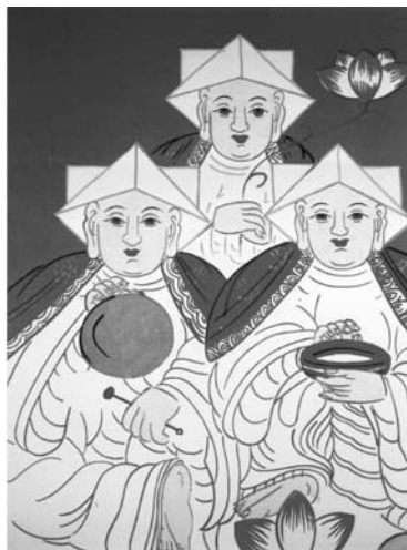
8.b kép A három Buddha képe