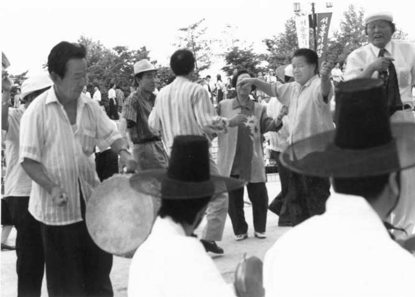
15. kép A közönség is részt vesz a szellemek mulattatásában

Koreában a katonai diktatúra rendszerének eltűnése után nagyon tudatos, nemzeti kulturális örökséget ápoló kultúrpolitika megszervezésére került sor. Ez azt jelentette, hogy az országos politika előterébe helyezték a hagyományos előadó- és a népművészetek különböző ágainak a támogatását. Ez utóbbiak körébe elsősorban a hagyományos kézművesség művelőit vonták be, míg az előadóművészetek közé a hagyományos népi hangszereken játszó előadókat, az énekeseket, a táncosokat és a népi maszkos színjátszókat sorolták be. Létrehozták az élő nemzeti kincs, vagyis emberi kulturális értékek ( ingan munhwajae ) és az ehhez kapcsolódó kitények a rendszerét. 15 A hivatalos elismerés mindazoknak kijárt, akik valamilyen formában őrizték a néphagyományt. A kulturális minisztérium 1990-ben már több mint ötezer ilyen elismerést jegyzett, mind a kézzel fogható, vagyis a tárgyi kulturális örökség, mind pedig a szellemi örökség területén.