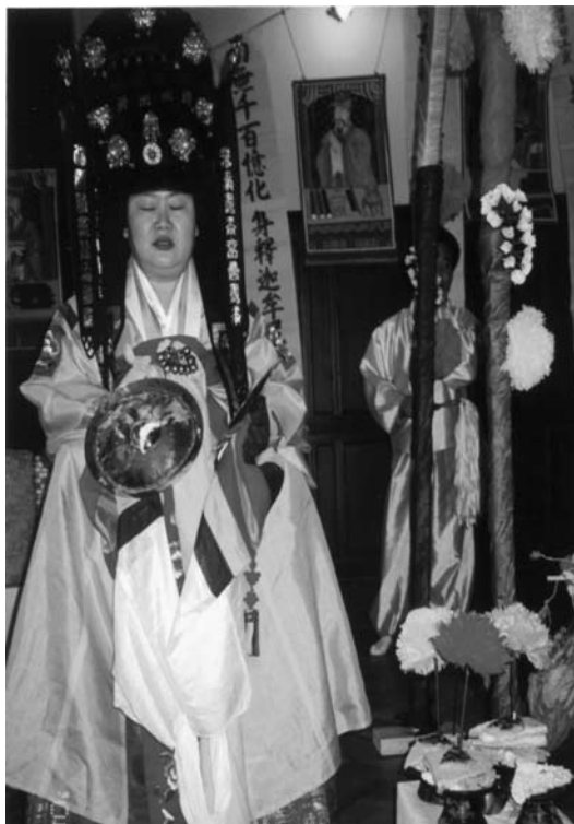
16. kép Hivatásos sámáncsoport budapesti előadása (2000)

Bármennyire is érződött, hogy előadásról van szó, az is nyilvánvalóvá vált a szemlélő számára, hogy a minőséget csak úgy lehet fenntartani, ha államilag támogatják a hagyományörzés professzionális mestereit. Nem ér-