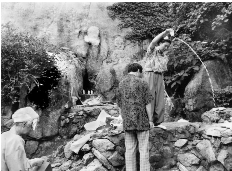
2. kép Sámánszertartás az Inwang hegyen – Szöul városában (1991)

Megjegyzendő, hogy ezen a hegyen nemcsak sámánasszonyok, hanem más hitet valló vallási specialisták, így buddhista szerzetesek is végzik szertartásaikat. Az érdekes alakú sziklák alatt buddhista szerzetesek mellett termékenységet váró asszonyok is gyakorta könyörögnek gyermekáldásért.