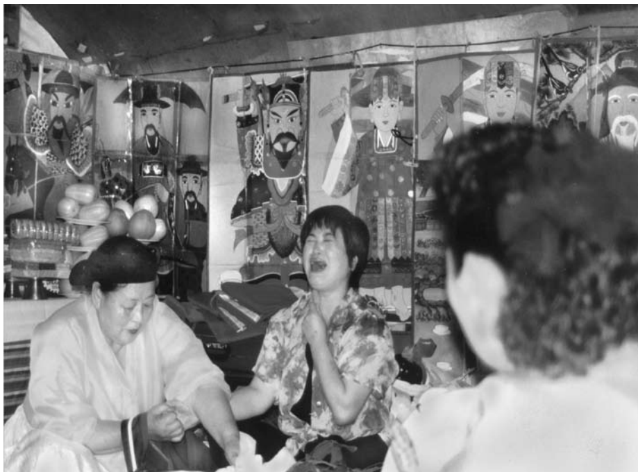
10. kép A sámánő halottidéző szertartása a szentélyben (1994)

és a szent elemek, illetve szertartásrészek között állandó átjárás van. Már csak azért is, mert a hosszú szertartás felvonásai között a negyedórás vagy félórás szünetekben a résztvevők együtt esznek-isznak, cigarettáznak, beszélgetnek és pihennek egy kicsit a sámánasszonyokkal. A nagy amerikai légitámaszpontjáról híres városka, Inchon külterületén egy szent hegy oldalában volt az a szentély, ahol a szertartásra sor került. Ide hozta ki otthonából a fősamán az ikonjait, amelyekkel feldíszítette az oltár mögötti részt. E szertartás során az elhunyt édesanya szellemét idézték meg, és az volt a megdöbbentő az idegen szemlélő számára, hogy a család tagjai közül ketten is milyen szívszorítóan őszintén élték át a szellem megidézésének pillanatait. Valójában az történt, hogy a sámánasszony énekével imitálta, vagy jelezte az elhunyt szellemének megérkezését és az ő hangján szólt a jelenlévők-