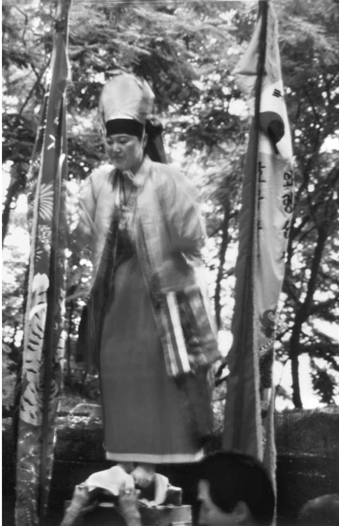
12.b kép A sámánő feláll az éles kardokra

sámánok nemcsak jól megélnek, hanem az állandó gyakorlás miatt konzer- válják is a régi ceremóniákat. Természetesen ez egyben azt is jelenti, hogy az új helyzetnek megfelelően a kor kívánalmaihoz igazodva új és új elemek épülnek be a sámánszertartásokba. S mivel magának a rítusnak a szerkeze- te meglehetősen rugalmas, ezért bármilyen környezetben és céllal is alkal- mazhatók, és ezek a változások, újítások nem érintik magának a rítusnak a jelentéstartalmát.