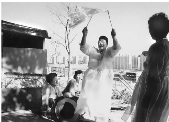
11. kép A háttérben Incheon új modern lakótelepei

Két nappal később, ugyanebben a szentélyben és ugyanannak a két sámánasszonynak a vezetésével egy szerencsehozó szertartáson vehettünk