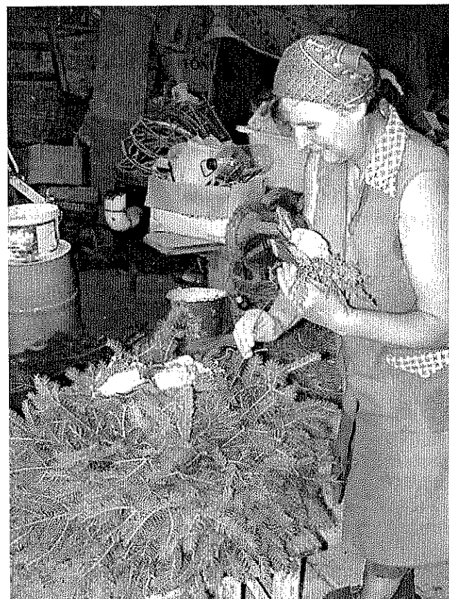
3. kép. Koszorúkészítés otthon (Fotó: Máté György, Nagyrákos, 2002)