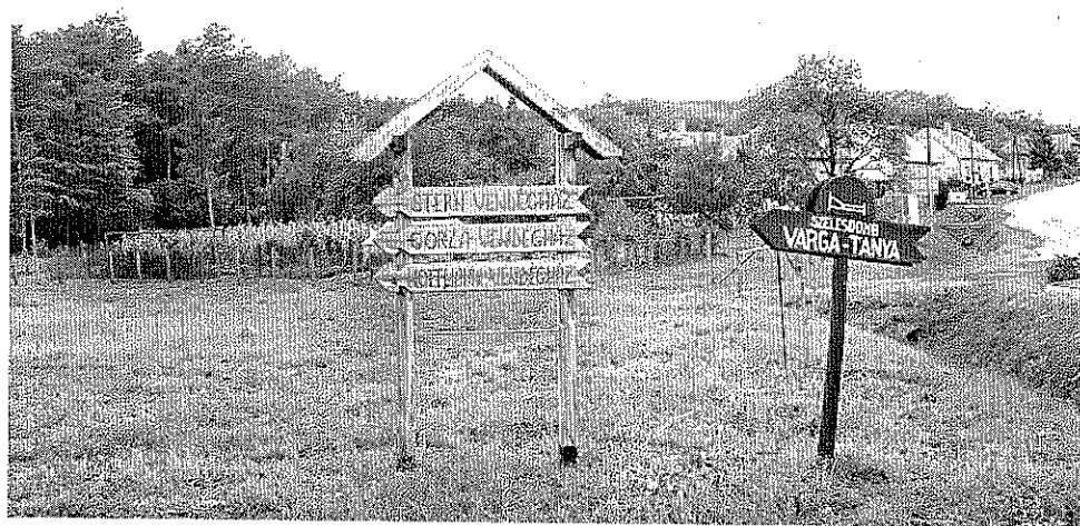
2. kép. Falusi turizmus (Fotó: Máté György, Nagyrákos, 2002)