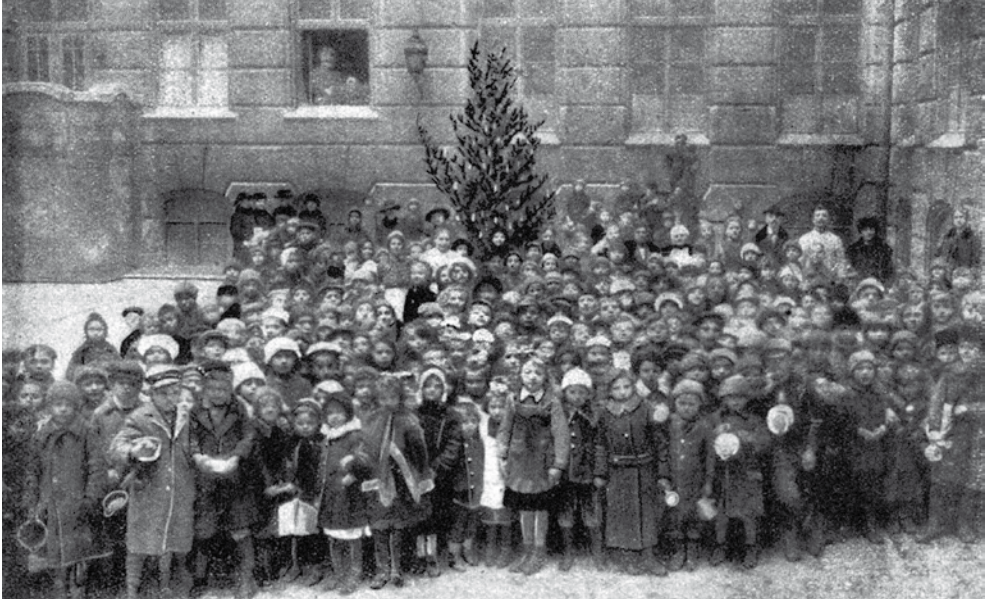
3. kép: Az amerikai misszió karácsonya a gyermekeknek ( Tolnai Világlapja , 1920. január 10. 5.)