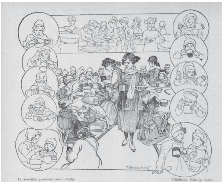
4. kép: Az amerikai gyermekmisszió ebédje, rajz ( Új Idők , 1920. 1. sz. 6.)